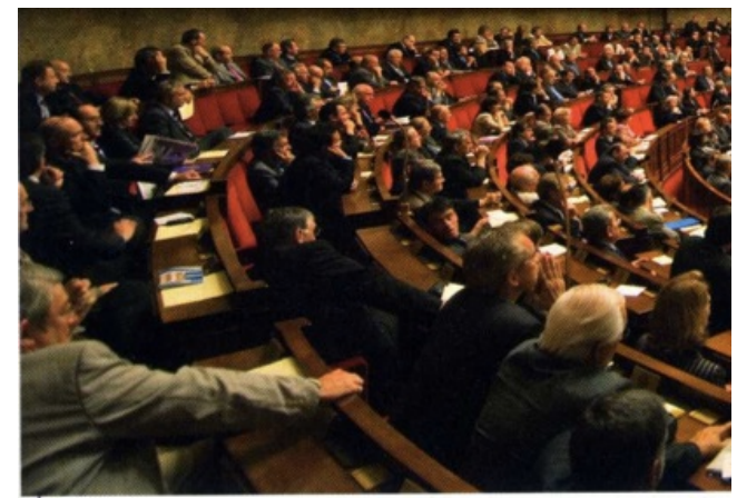
5 Les députés à l'Assemblée nationale en 2009.

D'après la loi n° 2000-493 du 6 juin 2000.