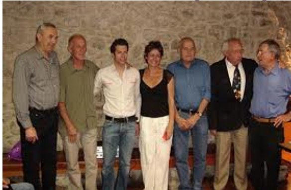
1 Madame Chaumont-Gorius, maire du village de Pierrevert (Alpes-de-Haute-Provence).