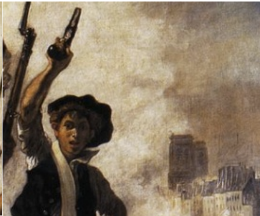
Le Gamin de Paris : va inspirer Victor Hugo (Notre-Dame aussi !)