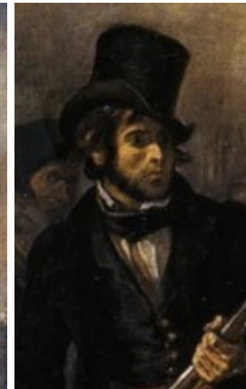
La nation française associe bourgeois et prolétaires (ce n'est pas une lutte marxiste)