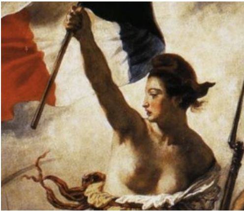
Une image révolutionnaire de la France : cette Marianne n'est pas pacifique !

L'IMPACT D'UNE ŒUVRE : (quelle a été l'histoire du tableau et son influence ?) Composition pyramidale classique. Allégorie de la liberté qui choque le public de l'époque. 1830 est une révolution "ratée" (retour à une monarchie qui contrôle l'opinion). Symbole encore actuel : Marianne, gavroche, les timbres postes, les reproductions.