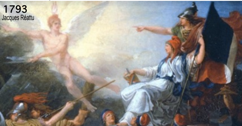
1793 Jacques Réattu

Autres représentations de la liberté et de Marianne :