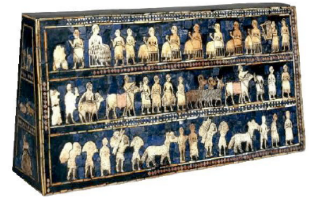
Document 1 : Etendard d'Ur, British Museum, Londres, vers 2650 avant Jésus-Christ

_____ _____ _____ _____ _____ _____ _____ _____