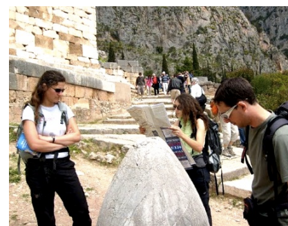
Document 10 L'Omphalos