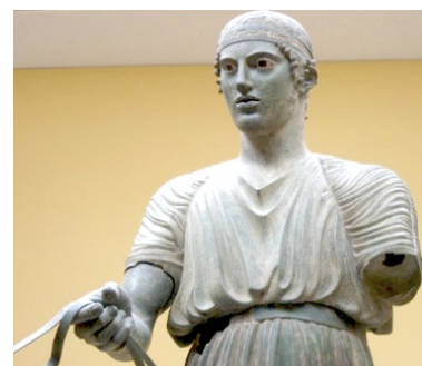
Document 8 L'Aurige