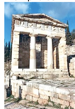
Document 11 Le trésor des Athéniens