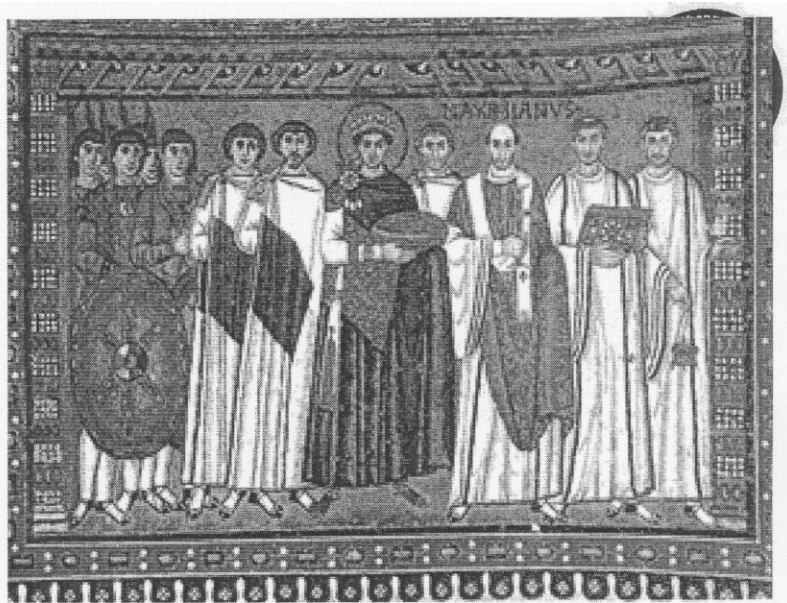
Doc.1 : L'empereur Justinien et les grands personnages de l'Empire, mosaïque de l'église Saint-Vital, Ravenne, Italie, VI e siècle